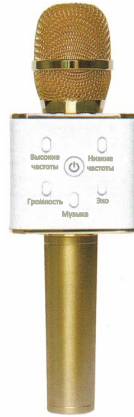
Беспроводной микрофон И HiFi-колонка – Q7